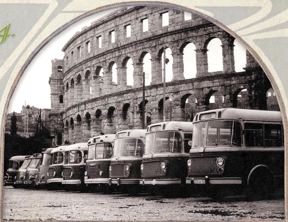
Autobusi tipa "Alfa" na Karolini. Neveliki gradski autoprijevozni park početkom šezdesetih godina 20. st. Corriere del tipo "Alfa" in Carolina. Il modesto parco trasporti pubblici all'inizio degli anni '60 del secolo XX.

studeni / martinšćak / novembre / novembre