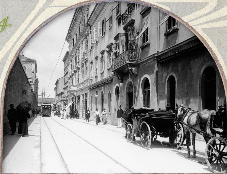
Čari velegrada: tramvaj, kočije, pulske dame i gradska gospoda u Arsenalskoj ulici. Snimio Alois Beer 1910. Fascino di una metropoli: tram, carrozze, dame e signori polesi in via dell'Arsenale. Foto di Alois Beer.