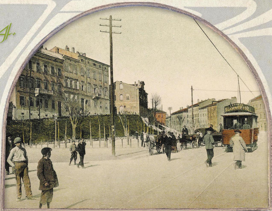
"Prometna gužva" na Giardinima, s tramvajem i ležernim pješacima koje ne brine njegova brzina (1905.). "Gran traffico" ai Giardini con il tram ed i pedoni imperturbati dalla sua velocità.