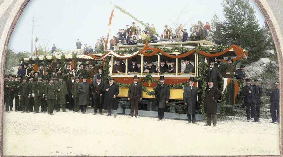
Soečano puštanje u promet pulskoga električnog tramvaja 24. ožujka 1904. Inaugurazione solenne del tram elettrico il 24 marzo 1904.

Romantica Pula u kočiji, tramvaju i kurijeri Pula romantica in carrozza, tram e corriera