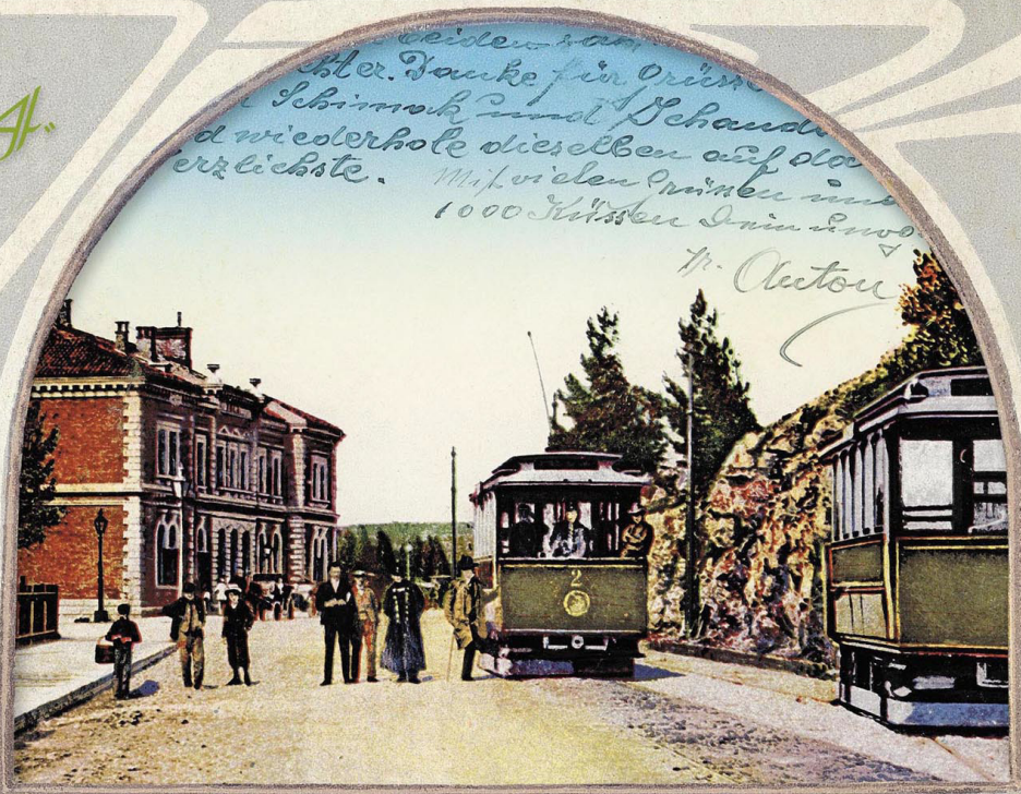
Polazna stanica električnog tramvaja na pulskom kolodvoru; godine 1914./1915. Capolinea del tram elettrico alla stazione ferroviaria polese, anni 1914-1915.