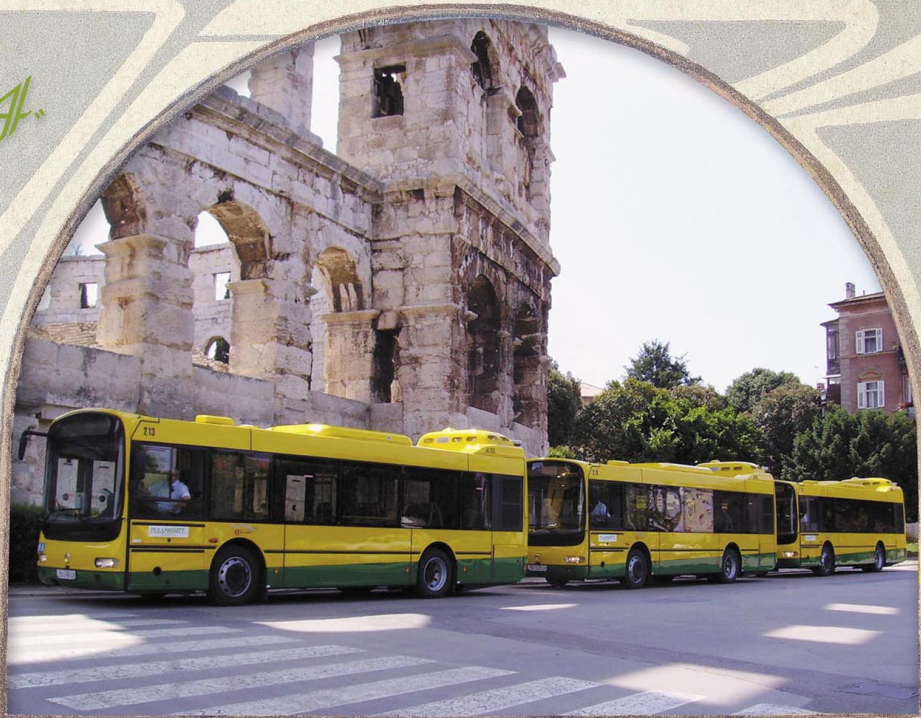
Novi autobusi Iveco Irisbus – Europolis u promotivnoj vožnji ispred Arene 14. lipnja 2007. Gli autobus nuovi "Iveco Irisbus – Europolis" in rivista davanti l' Arena, 14 giugno 2007.

prosinac / prosunac / dicembre / disembre