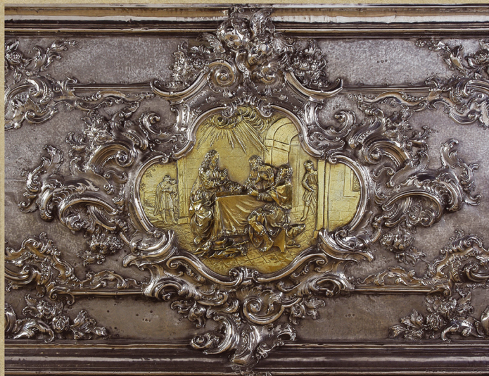
*PIETÀ DI EMANUELE NEDDALGO SEBASTIANI, ANTEFENDI OLTRA PRESVETOS, SACRAMENTA - (ZILATO, 48x62 CM.), AUTOR ANGELO SCARBARELLO, ESTE, 1777 (L'OPERA CRIVA SV. EUFEMIE U ROVAJUI). *CENA AD EMANUELE DELLA MOSTRA CENTRALE DELL'ANTEFENDI MOBILE DELL'ALTARE DEL SS. SACRAMENTO - (ORO, 48x62 CM.), AUTORE ANGELO SCARBARELLO, ESTE, 1777 (DUOMO DI S. EUFEMIA, ROVIGNO).