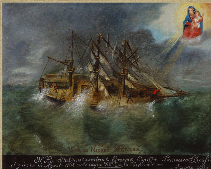
ZANETTI DALL'ISOLA MALUSA. IL SOLOVOZ/ANGUŠT (LULJE NA PLATNU, 1949 CM), AUTORE A. SOBEA (ZAVRČANI MUZEJ GRADA ROVINJA). SIMIO EDUARDO STREJNA. EX VOTO DI NICOLO MALUSA DI ROVINJO, 12 AGOSTO 1668 - (IOLO SU TELA, 35X51 CM), AUTORE A. SOBEA (MUSEO CIVICO DELLA CITTÀ DI ROVINJO). FOTO DI EDUARDO STREJNA.