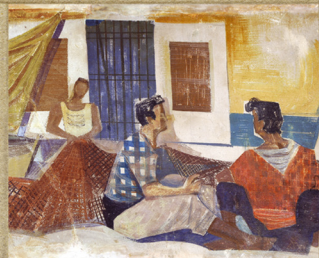
DETALI ŽIDWE: SLIKE "KOVINSKI KIBARI", SNIMIO EDUARD STREJNA. DETAGLIO DELLA PITTURA MURALE "PESCATORI ROVINJESKI", FOTO DI EDUARD STREJNA.