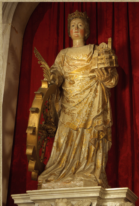
VERA UTRAQUE - STATUA DOVA SUČIJA IMA PRISUŠNOŠĆU IZ 17. ST. UČIOK IZREČENJE: 6. ST. OTOVA UTRAJEVA - UČIOK IMA DOVA SUČIJA IMA PRISUŠNOŠĆU IZ 17. ST. UČIOK IZREČENJE: 6. ST. SAVETA UTRAJEVA - UČIOK IMA DOVA SUČIJA IMA PRISUŠNOŠĆU IZ 17. ST. UČIOK IZREČENJE: 6. ST. (AUTOR: DR. SC. STRELA, DOKTOR DR. SC. STRELA)

4 5 6 7 8 9 10 11 12 13 14 15 16 17 18 19 20 21 22 23 24 25 26 27 28 29 30