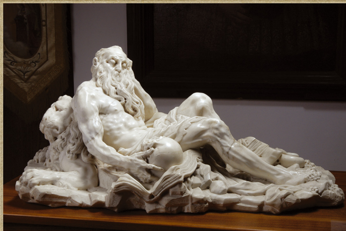
*SV. JERONIM - (MIRNOČENI KIP, 5920 CM), AUTOR GIOVANNI DONATZLA, VENEČIJA 1556 - PADOVA 1756. (KULIČEVIČKA ZIRKA PRARJEVAČKOG SAMOSTANA U ROVINJU). *S. GIROLAMO - (STATUA DI MARMO, 5920 CM), AUTORE GIOVANNI DONATZLA, VENEZIA 1556 - PADOVA 1756. (COLLEZIONE D'ARTE DEL CONVENTO FRANCISCANO DI ROVINJO).