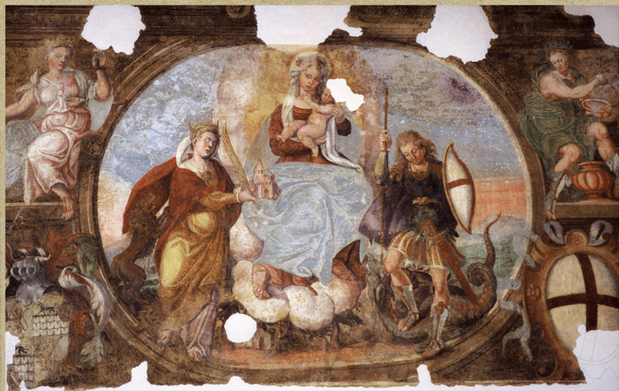
SREĐNJA SCENA FREZKE U VIŠIČINCI GRADA ROVINJA (240 X 1779 CM), NEPOZNATI AUTOR, 1981. ŠKIMO VIDOSLAV BARAC. SCENA CENTRALE DELL'AFFRESCO DELLA SALA CONSILIARE DELLA CITTÀ DI ROVIGNO (240 X 1779 CM), AUTORE IGNOTO, 1981. FOTO DI VIDOSLAV BARAC. (Freska je restaurirao Hrvatski restauratorski zavod iz Zagreba 2005. godine; restaurator Egipko Budnica). L'affresco è stato restaurato nel 2005 dall'Istituto croato di restauro di Zagabria; restauratore Egipko Budnica).