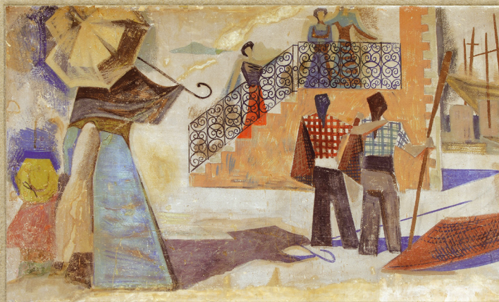
DETALI ŽIDWE: SLIKE "KOVINSKI KIBARI" (2005/05 CM), AUKTOR ROLINO MASCARELLI, 1991. IČARANA "VEČJA BATANI", ROVINJE, SNIMIO EDUARD STREJNA. DETAGLIO DELLA PITTURA MURALE "PESCATORI ROVINJESKI" (2005/05 CM), AUKTOR ROLINO MASCARELLI, 1991. (CAFÈ "VEČJA BATANI", ROVINJE). FOTO DI EDUARD STREJNA. (Slika iz 2005. godine restaurirana Radovan Obitri, restaurator, Komunalnog zavoda za kulture. La pittura murale è stata restaurata nel 2005 da Radovan Obitri, restauratore del Dipartimento conservatori di Trieste).

1 NED/DOM 2 PON/LUN 3 UT/MAR 4 SRI/MER 5 ČET/GIOV 6 PET/VEN 7 SUB/SAB 8 NED/DOM 9 PON/LUN 10 UT/MAR 11 SRI/MER 12 ČET/GIOV 13 PET/VEN 14 SUB/SAB 15 NED/DOM 16 PON/LUN 17 UT/MAR 18 SRI/MER 19 ČET/GIOV 20 PET/VEN 21 SUB/SAB 22 NED/DOM 23 PON/LUN 24 UT/MAR 25 SRI/MER 26 ČET/GIOV 27 PET/VEN 28 SUB/SAB 29 NED/DOM 30 PON/LUN 31 UT/MAR