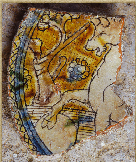
FRAGMENTI DEKORATIVNIH TANJURA S ALEGORIČNIM PRIZOROM (PROBOSKA - DOPOLNILENJE GRAFIKI, 14,5 X 10 CM), NEPOZNAVANI AVTORI, 16. ST. FRAGMENTI DI PIASTRE DECORATIVE CON RAPPRESENTAZIONE ALLEGORICA (SIL LACCOLATO - GRAFFITO INCIERTO, 14,5 X 10 CM), AUTORE IGNOTO, SEC. XV (COLLEZIONE PRIVATA DEL DOTT. VITTORIO PICCOLI - ROVIGANO, Inv. nr. 592)

1 PON/LUN 2 UT/MAR 3 SRI/MER 4 ČET/GIOV 5 PET/VEN 6 SUB/SAB 7 NED/DOM 8 PON/LUN 9 UT/MAR 10 SRI/MER 11 ČET/GIOV 12 PET/VEN 13 SUB/SAB 14 NED/DOM 15 PON/LUN 16 UT/MAR 17 SRI/MER 18 ČET/GIOV 19 PET/VEN 20 SUB/SAB 21 NED/DOM 22 PON/LUN 23 UT/MAR 24 SRI/MER 25 ČET/GIOV 26 PET/VEN 27 SUB/SAB 28 NED/DOM 29 PON/LUN 30 UT/MAR 31 SRI/MER