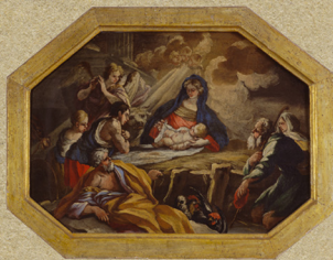
"POKLONITVO PASTIRŃ" - (ULJE NA DRVU, 36x50 CM), RADOŠIĆ LUKA GJORDANO, NAPOLI 1594-1601 IZBIRKA "STARIH MAJSTORŃ ZAV. ČAŠKOG MUZEJA GRADA KOVČINA", "ADORAZIONE DEI PASTORI" - (OLIO SU TAVOLA, 36x50 CM), BOTTEGA DI LUCA GJORDANO, NAPOLI 1594-1601 (COLLEZIONE D'ARTE ANTICA DEL MUSEO CIVICO DELLA CITTÀ DI ROVIGNO)