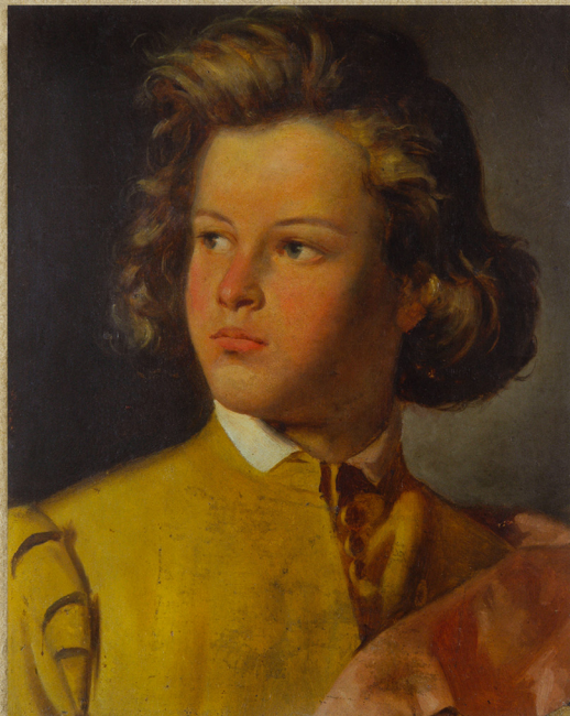
"PORTRAIT OF A YOUNG MAN" (ULLE IN SARTINI), 1824-25, AUTORE GREGG PETERMAN WACHSHELLER, 179-1845 (ZEMSKA - SREBRI MARIJETA I PAVELINOVA MUZEJA CRANA KOTLIKA), SINIO EDUARD STRENA (COLLEZIONE DI PARTE ABBATE DEL MUSEO CIVICO DI ROVERETO), FOTO DI EDUARD STRENA