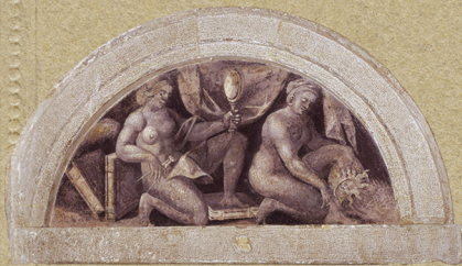
"UMIČERENOST" - (U LONJETI U ELJEVOM DORU) EM KUTU FREZKE, (1,5X22 CM), NEPOZNATI AUTOR, 1981. ŠKIMO VIDOSLAV BARAC. "LA TEMPERANZA" - ILLETTA NELL'ANGULO SOTTO IFFER ORR DELL'AFFRESCO, 40X22 CM), AUTORE IGNOTO, 1981. FOTO DI VIDOSLAV BARAC.