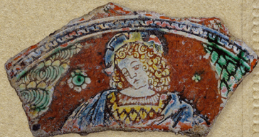
FRAGMENTI DEKORATIVNIH TANJURA S PREKAZOM 'PLAVOKOSOG PRILEMČA' (GRAFITNA KERAMIKA SA SPUŠTENIM DNOJEM, 16,5 X 5 CM), NEPOZNAVANI AVTORI, KRAJ 15./POČ. 16. ST. (PRIVATNA ZBIRKA DR. VIKTORIE PICOLOLLI, ROVIGANO, Inv. nr. 593) - SPOJNO EDUARDO STREJNA FRAGMENTI DI PIASTRE DECORATIVE CON RAPPRESENTAZIONE 'VITELLUCINO MICHORČ' (KERAMIKA GRAFITATA A FONDO ABBASSATO, 16,5 X 5 CM), AUTORE IGNOTO, FINE SEC. XV - INIZI SEC. XVI (COLLEZIONE PRIVATA DEL DOTT. VITTORIO PICCOLI - ROVIGANO, Inv. nr. 593)

1 PON/LUN 2 UT/MAR 3 SRI/MER 4 ČET/GIOV 5 PET/VEN 6 SUB/SAB 7 NED/DOM 8 PON/LUN 9 UT/MAR 10 SRI/MER 11 ČET/GIOV 12 PET/VEN 13 SUB/SAB 14 NED/DOM 15 PON/LUN 16 UT/MAR 17 SRI/MER 18 ČET/GIOV 19 PET/VEN 20 SUB/SAB 21 NED/DOM 22 PON/LUN 23 UT/MAR 24 SRI/MER 25 ČET/GIOV 26 PET/VEN 27 SUB/SAB 28 NED/DOM 29 PON/LUN 30 UT/MAR 31 SRI/MER