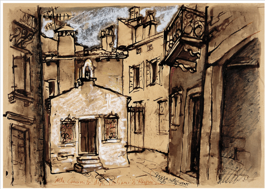
Cesce Desanti S. Benedetto, 1975 Cesce Desanti San Benedetto, 1975

1 čet/giov 2 pet/ven 3 sub/sab 4 ned/dom 5 pon/lun 6 ut/mar 7 ri/mer 8 čet/giov 9 pet/ven 10 sub/sab 11 ned/dom 12 pon/lun 13 ut/mar 14 ri/mer 15 čet/giov 16 pet/ven 17 sub/sab 18 ned/dom 19 pon/lun 20 ut/mar 21 ri/mer 22 čet/giov 23 pet/ven 24 sub/sab 25 ned/dom 26 pon/lun 27 ut/mar 28 ri/mer 29 čet/giov 30 pet/ven 31 sub/sab