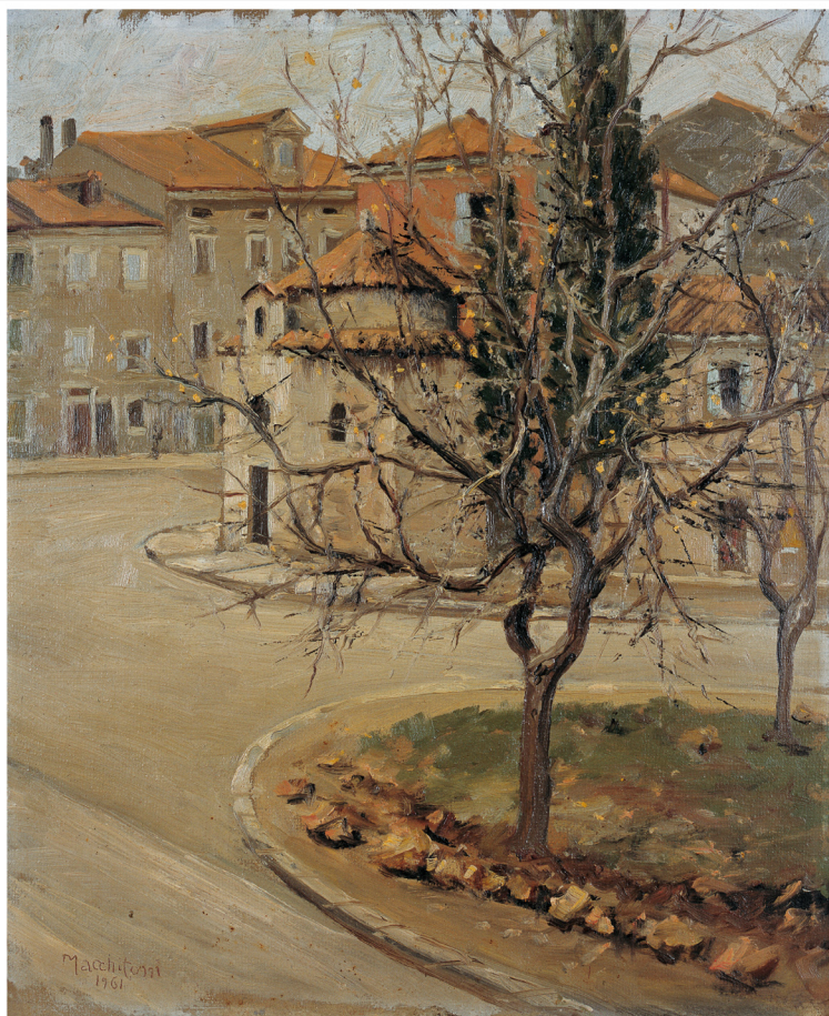
Franci Maudslayi, Trg na Leheri, 1961. Franci Maudslayi, Parizjani na Leheri, 1961

1 pon/lun 2 ut/mar 3 cri/mer 4 čet/giov 5 pet/ven 6 sub/sab 7 ned/dom 8 pon/lun 9 ut/mar 10 cri/mer 11 čet/giov 12 pet/ven 13 sub/sab 14 ned/dom 15 pon/lun 16 ut/mar 17 cri/mer 18 čet/giov 19 pet/ven 20 sub/sab 21 ned/dom 22 pon/lun 23 ut/mar 24 cri/mer 25 čet/giov 26 pet/ven 27 sub/sab 28 ned/dom 29 pon/lun 30 ut/mar 31 cri/mer