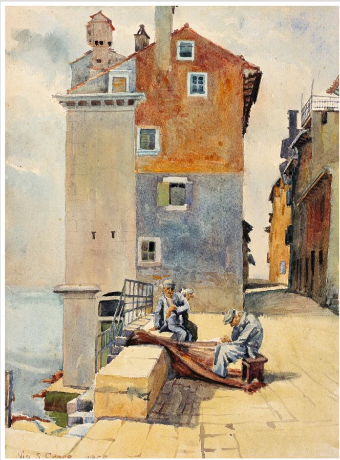
Egmont, Gari Ulica Sv. Krištofa, 1955. Egmont, Gari Ulica Sv. Krištofa, 1955.

1 ned/dom 2 pon/lun 3 ut/mar 4 sri/mer 5 čet/giov 6 pet/ven 7 sub/sab 8 ned/dom 9 pon/lun 10 ut/mar 11 sri/mer 12 čet/giov 13 pet/ven 14 sub/sab 15 ned/dom 16 pon/lun 17 ut/mar 18 sri/mer 19 čet/giov 20 pet/ven 21 sub/sab 22 ned/dom 23 pon/lun 24 ut/mar 25 sri/mer 26 čet/giov 27 pet/ven 28 sub/sab 29 ned/dom 30 pon/lun 31 ut/mar