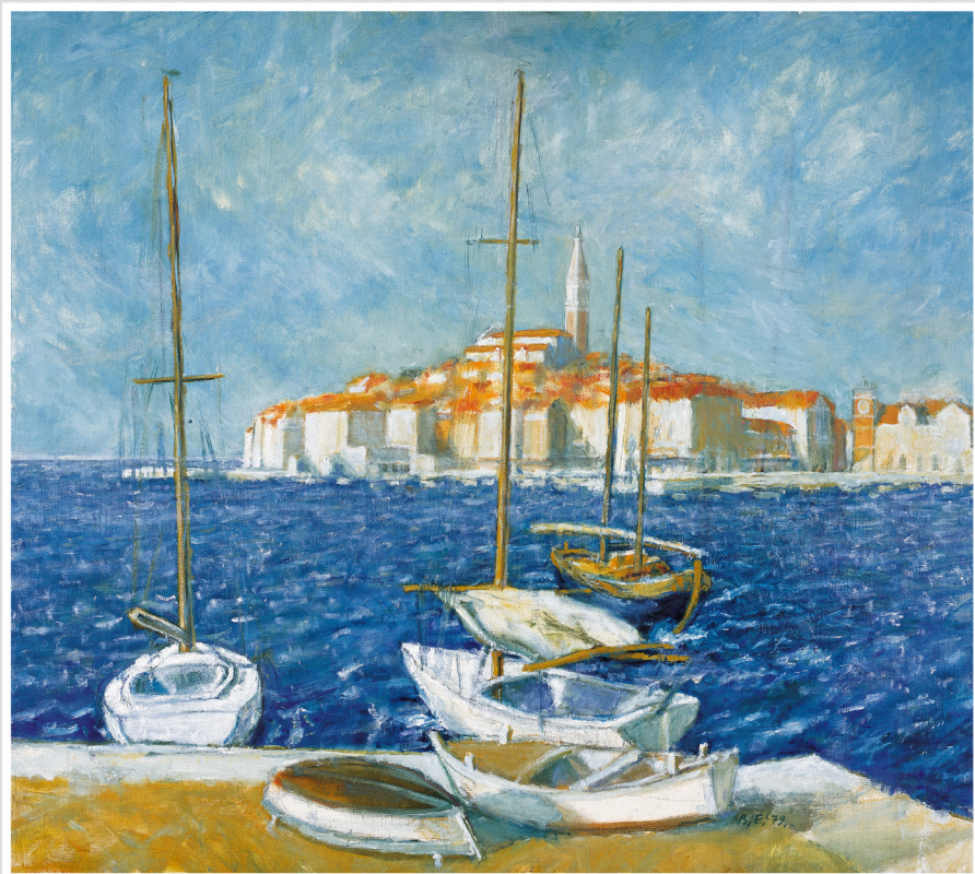
Egidio Budicin: Bijeli jazo, 1979. Egidio Budicin: Smeo bianco, 1979.

1 sub/sab 2 ned/dom 3 pon/lun 4 ut/mar 5 sri/mer 6 čet/giov 7 pet/ven 8 sub/sab 9 ned/dom 10 pon/lun 11 ut/mar 12 sri/mer 13 čet/giov 14 pet/ven 15 sub/sab 16 ov. Fu/S. Ćuf. 17 pon/lun 18 ut/mar 19 sri/mer 20 čet/giov 21 pet/ven 22 sub/sab 23 ned/dom 24 pon/lun 25 ut/mar 26 sri/mer 27 čet/giov 28 pet/ven 29 sub/sab 30 ned/dom