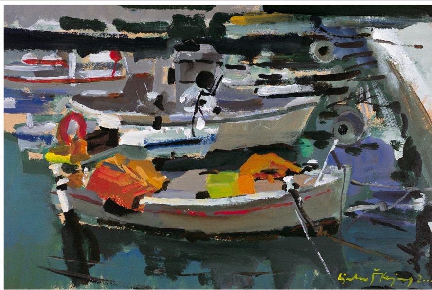
Ljubo Škrajec: Rovinjske latane, 2000. Ljubo Škrajec: Batane sovražni, 2000.

1 ori/mer 2 čet/giov 3 pet/ven 4 sub/sab 5 ned/dom 6 pon/lun 7 ut/mar 8 ori/mer 9 čet/giov 10 pet/ven 11 sub/sab 12 ned/dom 13 pon/lun 14 ut/mar 15 ori/mer 16 čet/giov 17 pet/ven 18 sub/sab 19 ned/dom 20 pon/lun 21 ut/mar 22 ori/mer 23 čet/giov 24 pet/ven 25 sub/sab 26 ned/dom 27 pon/lun 28 ut/mar 29 ori/mer 30 čet/giov 31 pet/ven