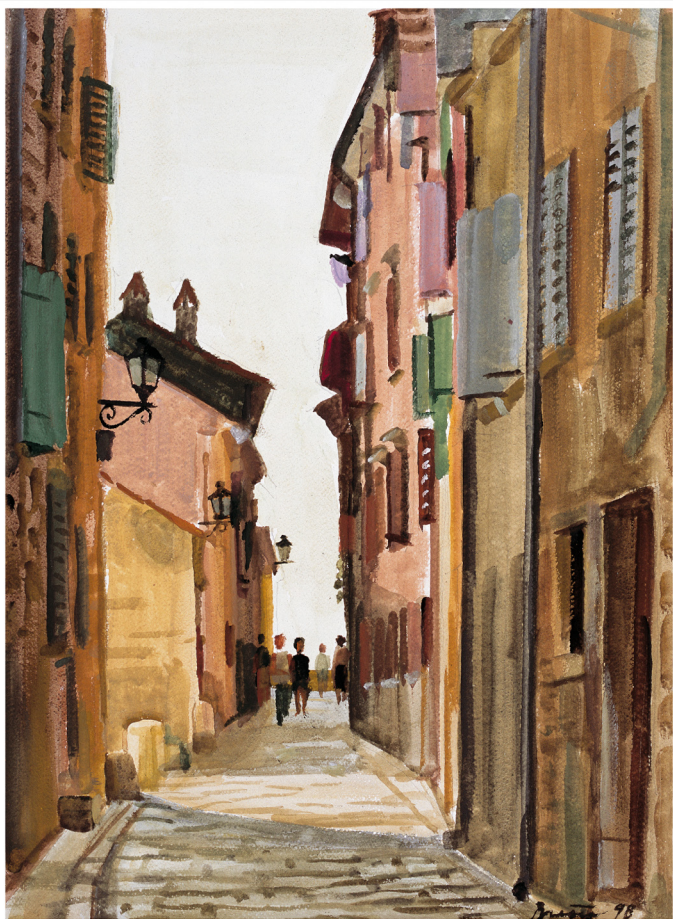
Vjebanica Brnčić Ulica St. Krišpa 1998. Vjebanica Brnčić Via Santa Croce, 1998

1 ut/mar 2 sri/mer 3 čet/giov 4 pet/ven 5 sub/sab 6 ned/dom 7 pon/lun 8 ut/mar 9 sri/mer 10 čet/giov 11 pet/ven 12 sub/sab 13 ned/dom 14 pon/lun 15 ut/mar 16 sri/mer 17 čet/giov 18 pet/ven 19 sub/sab 20 ned/dom 21 pon/lun 22 ut/mar 23 sri/mer 24 čet/giov 25 pet/ven 26 sub/sab 27 ned/dom 28 pon/lun 29 ut/mar 30 sri/mer 31 čet/giov