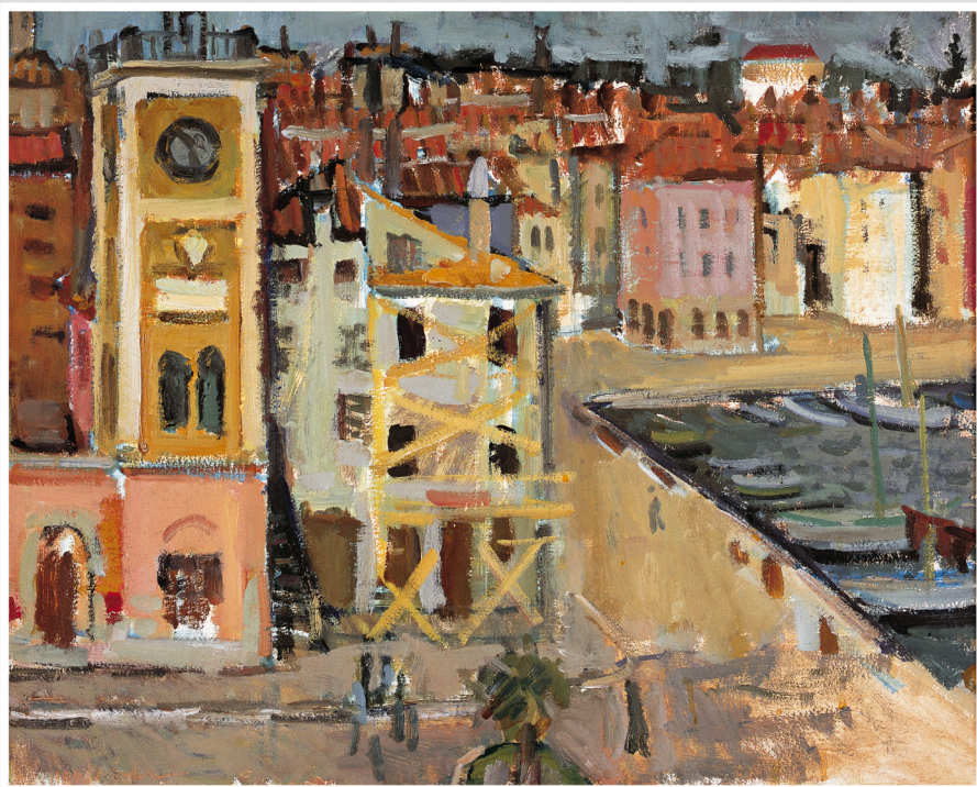
Vilho Sefron Rovinj, 1954. Vilho Sefron Rovigno, 1954

1 ned/dom 2 pon/lun 3 ut/mar 4 sri/mer 5 čet/giov 6 pet/ven 7 sub/sab 8 ned/dom 9 pon/lun 10 ut/mar 11 sri/mer 12 čet/giov 13 pet/ven 14 sub/sab 15 ned/dom 16 pon/lun 17 ut/mar 18 sri/mer 19 čet/giov 20 pet/ven 21 sub/sab 22 ned/dom 23 pon/lun 24 ut/mar 25 sri/mer 26 čet/giov 27 pet/ven 28 sub/sab 29 ned/dom 30 pon/lun