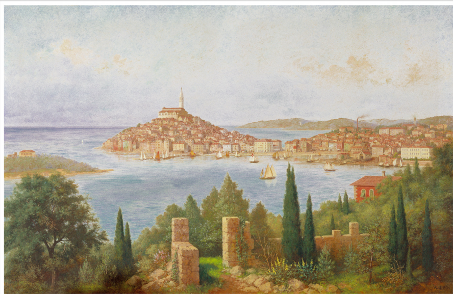
R. Woltack: Veluta Rovinja. Pечатok XX. stoljeća R. Woltack: Veluta di Rovigno. Inizio del sec. XX