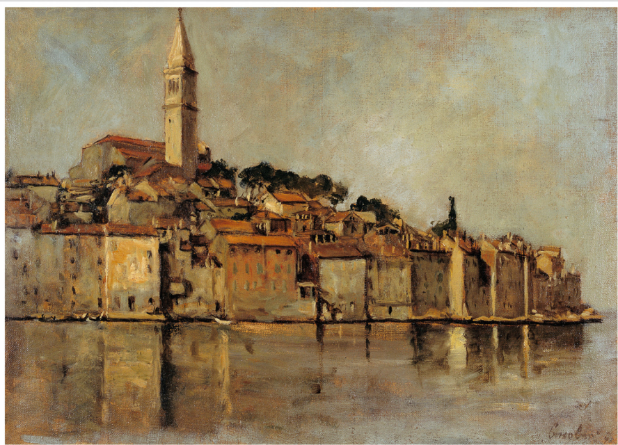
Josip Cankar's Rovinj, 1942. Josip Cankar's Rovinj, 1942

1 čet/giov 2 pet/ven 3 sub/sab 4 ned/dom 5 pon/lun 6 ut/mar 7 ori/mer 8 čet/giov 9 pet/ven 10 sub/sab 11 ned/dom 12 pon/lun 13 ut/mar 14 ori/mer 15 čet/giov 16 pet/ven 17 sub/sab 18 ned/dom 19 pon/lun 20 ut/mar 21 ori/mer 22 čet/giov 23 pet/ven 24 sub/sab 25 ned/dom 26 pon/lun 27 ut/mar 28 ori/mer