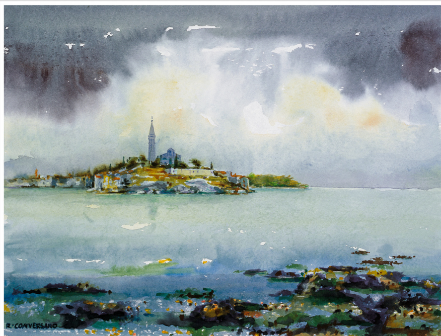
Romano Conversano: Rovine a dati, 1958. Romano Conversano: Rovine nell'anima, 1958

1 pet/ven 2 sub/sab 3 ned/dom 4 pon/lun 5 ut/mar 6 cri/mer 7 čet/giov 8 pet/ven 9 sub/sab 10 ned/dom 11 pon/lun 12 ut/mar 13 cri/mer 14 čet/giov 15 pet/ven 16 sub/sab 17 ned/dom 18 pon/lun 19 ut/mar 20 cri/mer 21 čet/giov 22 pet/ven 23 sub/sab 24 ned/dom 25 pon/lun 26 ut/mar 27 cri/mer 28 čet/giov 29 pet/ven 30 sub/sab