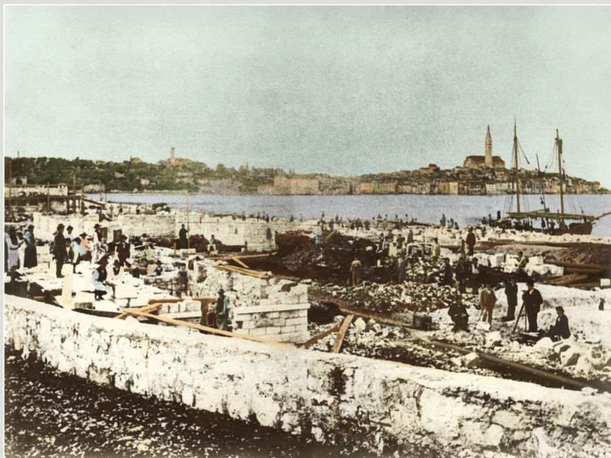
Gradina 1976. Z bronzofotke koji nadzirajuje obadvoj predin gran Nena fotografirati se objektu aluano prema velikom gradilištu poljoprivredne stanice koji su nadzirali projektisti 22. januara 1976. Dana 19. februara 1976. u Rovinju se prvi put dva putnika fotografije ulaka koji je stigao iz Kanfana Be 1976. della costruzione che stanno in fronte di vista della terra, l'edificio della macchina fotografica, si apriva sui grandi fari in che fenomeno per la costruzione della stagione fenocianica, iniziata il 22 dicembre 1975. Il 19 agosto del 1976 s'odi anche a Rovigno il fischietto del primo treno, proveniente da Capoferra. (Mura nepognati, Galano sannoino, Gricola / Calligaris, 1976 - Infrastruttura, Odjek Dula)

1 ut/mar 2 sri/mer 3 čet/giov 4 pet/ven 5 sub/sab 6 ned/dom