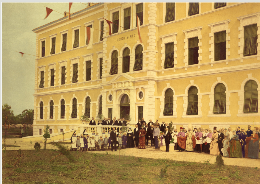
22. suvija 1888: Skopna fotografija iz zgod. knjižnice "Engelengojn Maria Terezia" na dan vjropane obnavljanja. Medu knjižnim ugostiteljima pripravljajo se, v imenici, nadozvajkinja Maria Terezia iz Breganze, galilajska kraljica, vjrogin supnog nadozvajada Karl Ludovic, pedeset let Malteser Campitelli (s. buke lom ovjroca u naci), Rovinjci: Bonanada Bonassi (jigrod djece, vijunal i Galvina iur lica nadozvajada) te d'istop Giovanni Battista Pagan. Medu vladarima, suostanasti su najostiji i namjesnik Evamario Franz Tullenkogen, Genog van Vellewalle, gonod iur, Gledogojn, Gledogojn Eduard Gledogojn Luigi Mani, te nadozvajici: p'opozijici d'anonici. Vata d'igruppa d'anonici d'180 suigjin "Engelengojn Maria Terezia" nel jianna dell'inaugurazione, il 22 maggio 1888. Si ricominciano, fra i numerosi onorevoli, a' censo l'inaugurazione Maria Terezia di Breganze, protettrice dell'ospedale, il sinasco Carlo Ludovico, il sinasco Malteser Campitelli Duella d'istop con la mano un mezzo di finici inauguraci Bonanada Bonassi la siniciva, d'anonici d'anonici i Galvina iur Galvina iur Gledogojn Eduard Gledogojn Luigi Mani, te nadozvajici: p'opozijici d'anonici, il lungasceno del litanale Franz Tullenkogen, Genog Vellewalle, il consiglio edile Stiasny, i medici Eduard Gledogojn Luigi Mani, il preposito ed i canonici nadozvajici. Fotografija / Foto di: Gledogojn Franz Tullenkogen, Gledogojn Gledogojn, Gledogojn Gledogojn Luigi Mani, il consiglio edile Stiasny, i medici Eduard Gledogojn Luigi Mani, il preposito ed i canonici nadozvajici. Fotografija / Foto di: Gledogojn Franz Tullenkogen, Genog Vellewalle, il consiglio edile Stiasny, i medici Eduard Gledogojn Luigi Mani, il preposito ed i canonici nadozvajici.