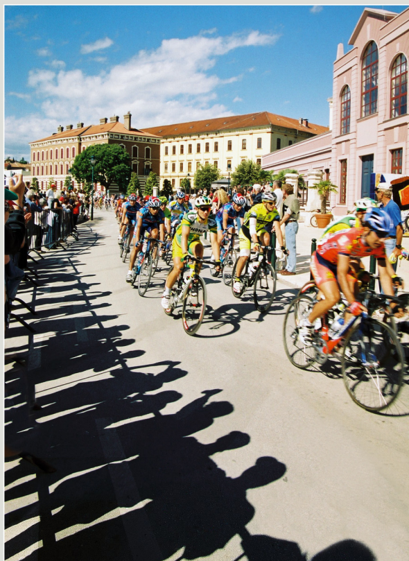
23. oktobra 2008. Bunkarji se pripravljajo na svoj prvi, eden izmed 38 km dolgega, ključnega kroga 2. etape. Na splošno je to prvi, v katerem se prične pripravljati na pravo dirko. Na dan je bilo veliko ljudi, ki so prišli gledati na dirko. Vsi so bili zelo navdušeni.