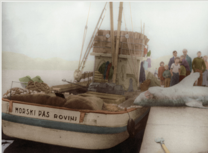
Veliki mornički pas, koji se u rujnu 1965. pojavio u mrežu kodu "Mornički" ribarskog broda "Mornički pas", čiji je kapetan bio Janko iz Marlene, plivao je veliku pagonaš i gvaljevu Rovinjaca u Valdičani. Bez obzira na impresivne dimenzije, bila je to jedna pasna dekadna unta mornički pas koja se hrani planktonom i malim ribama. U grande pascione, impigliatosi nel settembre del 1965 nella cacciata del malpascheresco "Mornički pas" del censurificio "Mina", capitano da Janko di Marlen, desta grande interesse e curiosità tra i Rovinjensi in Valdičana. Merquede lo suo dimensioni si trattava di una specie assolutamente inusuale, che si nutre di plancton e piccoli pesci.

1sri/mer 2čet/giow 3pet/ven 4sub/sab 5ned/dom