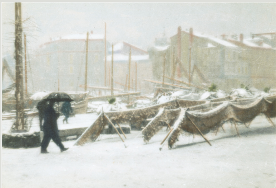
14. februaire 1928. Itelika kladnaca, 10 cet'jivnik' izpod nefe. Sujez'jlo je, lui dana garedom, ite je gadmirno suadago, kaduci de je nefe ita ima spredna drva, sed' ni podgorinvedeciji. Sujez' je, iue garedo, nefe je njez' garedom dit' deda vize na 20 centimetra. Da di se ogizati, gadi se, fejeji, iue, ite je, dit' ad drveca, slava i nepodn'og'jiv stofice, d'upa, cak i k'ovocit'ic'. Ovim njez'ima Gulsina Segonist' u suz'jiv "Kvanikama" sujedoci a nesukidat'isuz'jiv kladnaci i sujez'ni nocani fejeji, iue 1928 garedo garedo Rouinj' i "garedo" i vidarske nefeje "danda na nise" "Zelafelina". 14. februaire 1928. Fredda talansa. Grad' 10 cet'jivnik' sallegene. Nevic' per fea giani canoccoliti, con gnan pensione di fusti, pende p'noviste di legna nessuna ne anca, nemmeno i cantadini. Le nane anca felle seaffe e in certi punti superava i cinquanta centimetri. Ben scattansi si ulfiggona qualitate oggetta di legna, sedie canop'pand'it'ic, p'anche, pensio anca talansa, con questo parole d'it'arvo Segonist' discrivono nelle iue "Canacada" il fredda e la nevicata occorrenza che agli inizi di februaire del 1928 investirona Rouigno e "sarpasena" nel'e barche in nise salafelina. 14. fejeji / Dal volume: Rouinj' na stanim regjednicama - Rouigno nelle vecchie cantadine, 1996, str. p. 102

1ut/mar 2sri/mer 3cet'giou 4pet'ven 5sub/sab 6ned'dom 7pon/tun 8ut/mar 9sri/mer 10cet'giou 11pet'ven 12sub/sab 13ned'dom 14pon/tun 15ut/mar 16sri/mer 17cet'giou 18pet'ven 19sub/sab 20ned'dom 21pon/tun 22ut/mar 23sri/mer 24cet'giou 25pet'ven 26sub/sab 27ned'dom 28pon o /tun 29ut/mar 30sri/mer