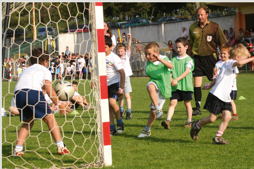
22. suidaja 2007. Delfiki "bravni" dječija ekipa i malinašima sudjelujući u jubilejnom "1. Dječje Olimpijadi" na zadužju udruženja socijalna i organizacijska Zavičaj iz Rovinja. Udruga organizirala i organizirala udruga "Neva" i "Haridala". 22 maggio 2007. In grandissima plausa alle bambine ed ai bambini partecipanti alla "1. Olimpiade dell'infanzia", per la gioia delle loro marce e degli organizzatori l'Unione sportiva, l'Associazione dei cineasti e gli asili "Haridala" e "Neva" della Città di Rovigno.

1 pon/tun 2 ut/mar 3 sri/mer 4 čet/giuv 5 pet/ven 6 sub/sab 7 ned/dom 8 pon/tun 9 ut/mar 10 sri/mer 11 čet/giuv 12 pet/ven 13 sub/sab 14 ned/dom 15 pon/tun 16 ut/mar 17 sri/mer 18 čet/giuv 19 pet/ven 20 sub/sab 21 ned/dom 22 pon/tun 23 ut/mar 24 sri/mer 25 čet/giuv 26 pet/ven 27 sub/sab 28 ned/dom 29 pon/tun 30 ut/mar 31 sri/mer